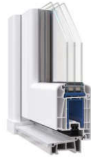
WDS 70 мм