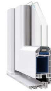
WDS 60 мм